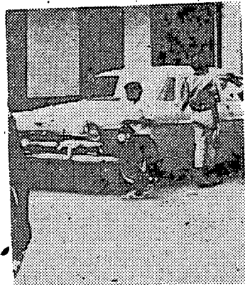
CON LOS FANGIOS

—“La peor de las dificultades con que tropezó la Feria —respondió el Dr. Rodríguez—, fue el escepticismo con que se veía este certamen desde un principio ya que eran contadas las personas que creían en la realización de la misma, lo que hace más satisfactoria nuestra labor ya que esta actividad culminó con el mayor de los éxitos y el comité organizador ha estado recibiendo felicitaciones desde todos los rincones del Istmo, por lo que es un deber de los que se encargarán de su organización el próximo año de presentar una mejor feria ya que no tendrán las dificultades de la Primera.”